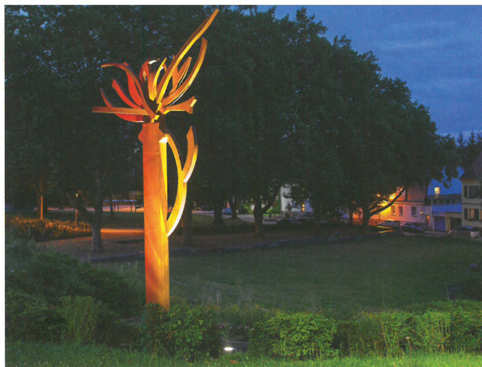
Die Stahlskulptur in Blütenform

wurden, ebenfalls unter Beteiligung der Öffentlichkeit, im Jahr 2013 teilräumliche Entwicklungskonzepte aus dem Gemeindeentwicklungskonzept abgeleitet. Mit der Gesamtmaßnahme Ortszentrum Quierschied soll die Ortsmitte von Quierschied ein neues städtebauliches Erscheinungsbild erhalten. In der Ortsmitte konzentrieren sich Einzelhandels- und Dienstleistungsangebote sowie viele öffentliche Einrichtungen (Rathaus, Schule, Kindergarten, Sportstätten). Städtebaulicher Handlungsbedarf besteht vorrangig in der Haupteinkaufsstraße aufgrund von leer stehenden Läden und Geschäften sowie am Standort des ehemaligen Rathauses. Heute befindet sich hier eine ungestaltete Brachfläche, da im Jahr 2009 nach einem Unwetter aufgrund von Bauschäden das Rathaus mit Bibliothek und Kultursaal abgerissen werden musste.