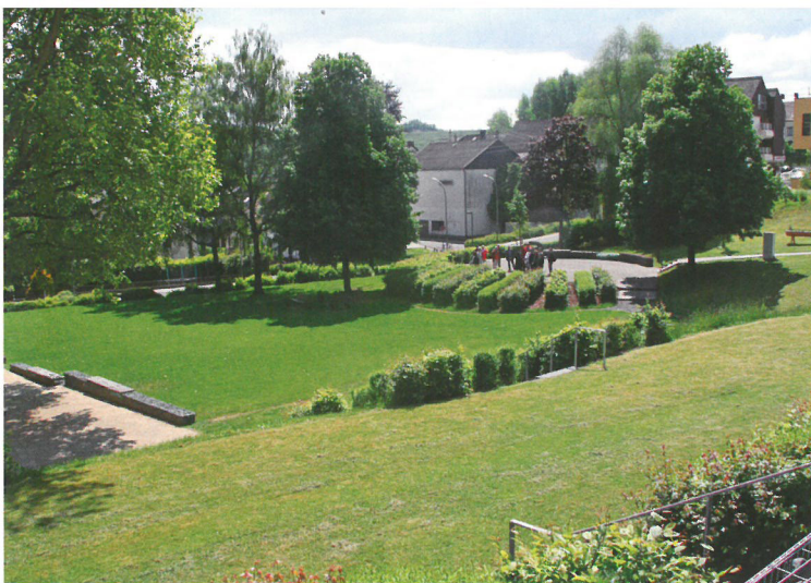
Blick in den Parkanlage Eisengraben